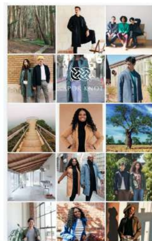
ソーシャルメディアコンテンツ